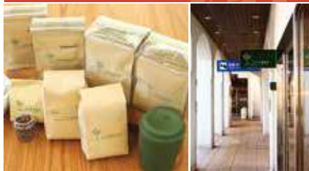
1.持ち帰り用の豆やドリップコーヒーも 2.店舗外観