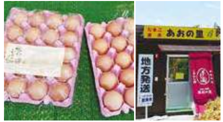
1.播州こく旨卵 2.店舗外観