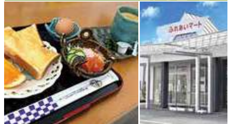
1.モーニング 2.店舗外観