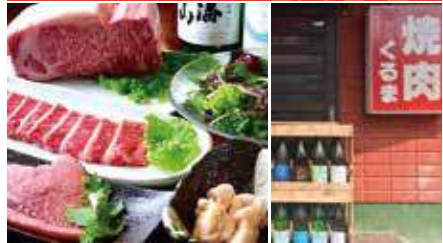
1. 豊富な部位をご用意 2. 店看板