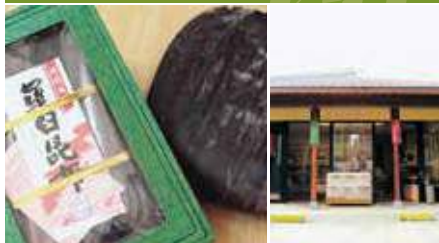
1.羅臼昆布 2.店舗外観