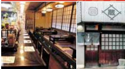
1.店舗内観 2.店舗外観