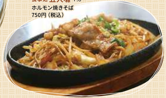
食事処 五人囃 P.8 ホルモン焼きそば 750円(税込)