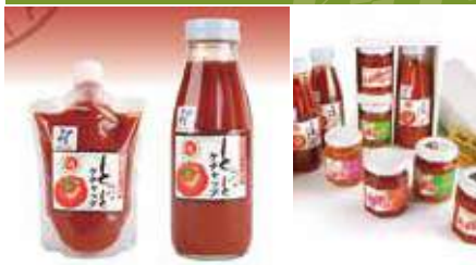
1.おとなのケチャップ 2.ケチャップやジャム