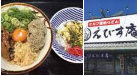
1.お好みのトッピングで 2.この看板が目印