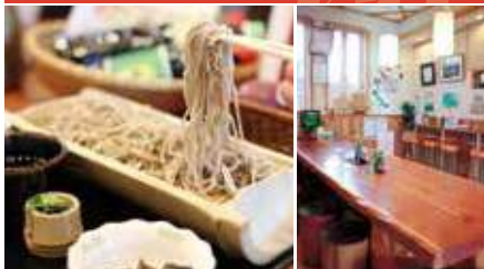
1.本格手打ちそば 2.店舗内観