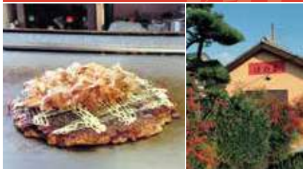
1.ほのか焼 2.店舗外観