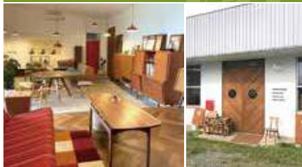
1.のんびり、ゆっくりした自分時間の脇役に 2.店舗外観