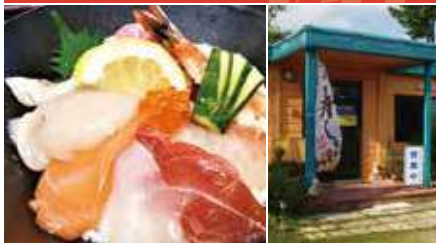
1.新鮮な海鮮丼 2.店舗外観