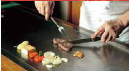
本格的なステーキ料理