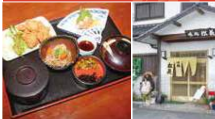
1.日替り定食(コーヒー付) 2.店舗外観