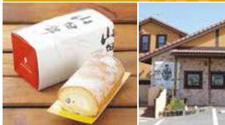
1.山田錦ロール 2.店舗外観