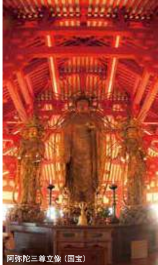
阿弥陀三尊立像(国宝)