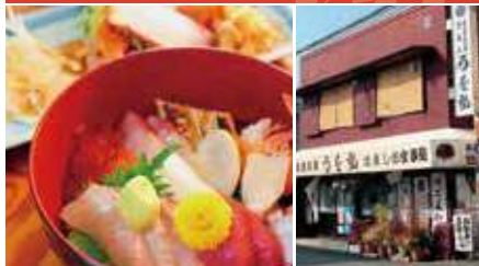
1.新鮮な海鮮丼 2.店舗外観