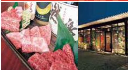
1.こだわりの肉 2.店舗外観