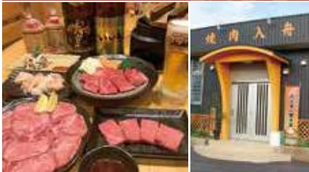
1. 牛、豚、鶏、海鮮など種類豊富 2.6～12名様までの個室あり