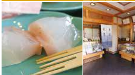
1. いちじく餅 2. 店舗内観