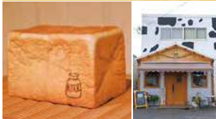
1.みるくパン「源」 2.店舗外観