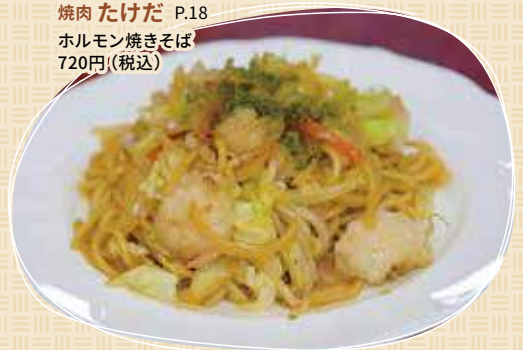
焼肉 たけだ P.18 ホルモン焼きそば 720円(税込)