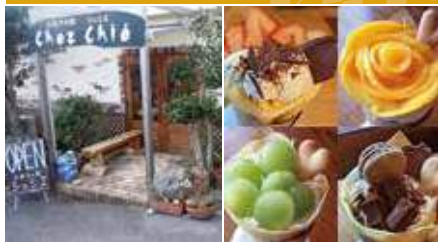
1. 店舗外観 2. 土日限定クレープ