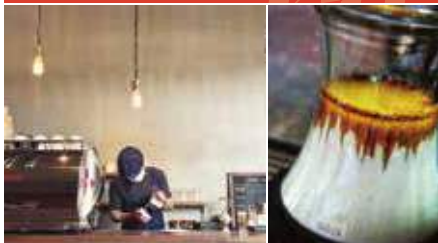
1.SCAJコーヒーマスターが淹れてくれる 2.エスプレッソの甘みを感じられるラテ