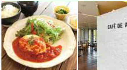
1.期間限定 手作りチーズハンバーグ 2.開放感溢れるカフェ