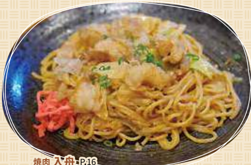
焼肉 入舟 P.16 おの恋ホルモン焼きそば 660円(税込)