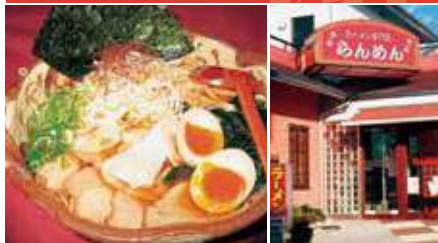
1. まんぷくラーメン 2. 店舗外観