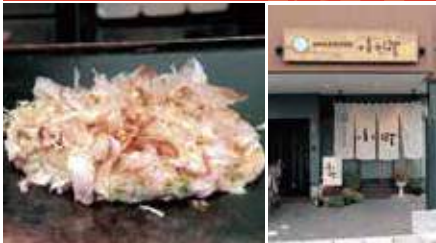
1.コロ焼き650円 2.店舗外観