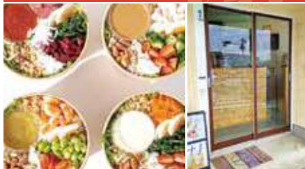
1.一食分の栄養がとれるサラダボウル 2.店舗外観