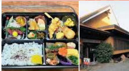
1.お弁当は予算におうじて 2.店舗外観