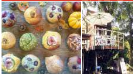
1.焼きたてマフィン 2.ツリーハウス