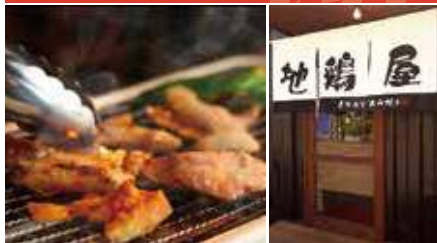
1.鶏焼肉は自分で焼いて食べるスタイル 2.店舗外観