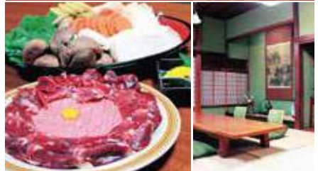
1.鴨鍋(11～3月のみ) 2.古風な内観