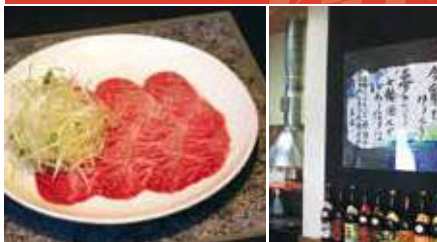
1.こだわりの肉 2.店舗内観