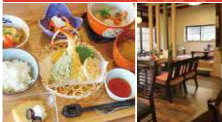
1. ふるさと膳 2. める店内