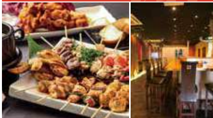
1.肉盛りコース 2.カウンター席