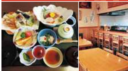
1.日替わり定食 2.店舗内観