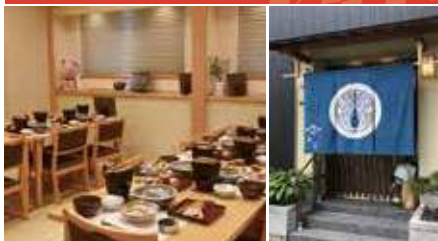
1.お座敷 2.2013年にリニューアルオープン