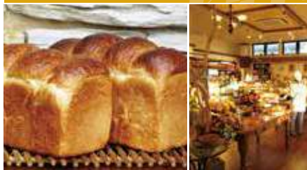
1.春よ恋 2.お洒落な店内