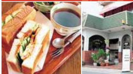
1.ホットサンド 2.店舗外観