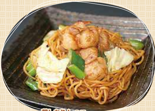
夢しちりん P.17 ホルモン焼きそば 825円(税込)