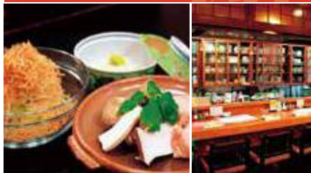
1.常連人気のパリパリサラダ 2.店舗内観