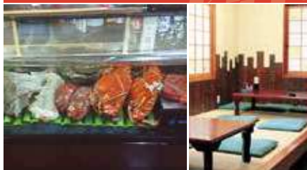
1.魚・鳥・肉ネタケース 2.店舗内観