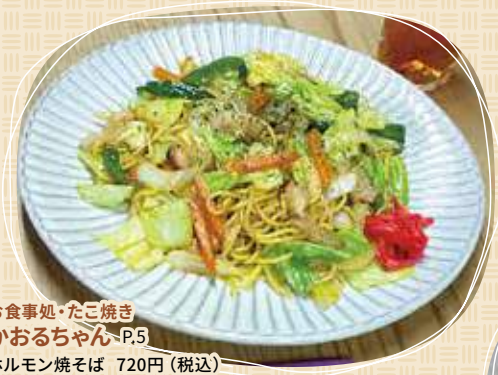
お食事処・たご焼き かおるちゃん P.5 ホルモン焼きそば 720円(税込)