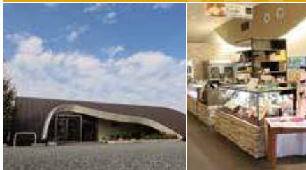
1.チョコレート山の丘をイメージ 2.広い店内