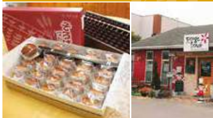
1.そろばんマドレーヌ 2.赤い外壁が目印