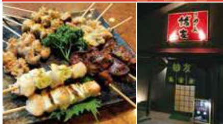
1.自慢の焼き鳥 2.店舗外観