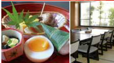
1.会席の前菜 2.イス席