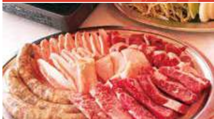
但馬牛入盛り合わせBBQ