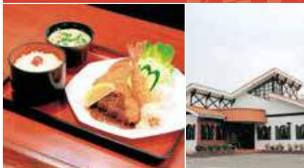
1.四季定食 2.店舗外観