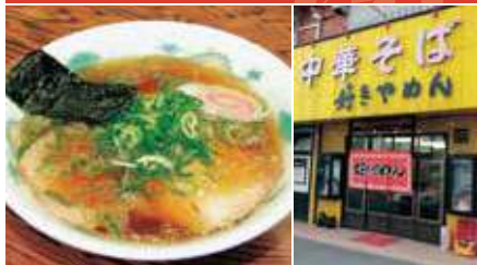
1. 醤油ラーメン 2. 店舗外観