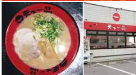
1.こってりラーメン 2.店舗外観