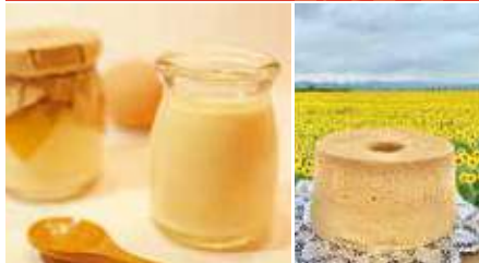
1.ひまわりプリン 2.独自の製法で作るシフォンケーキ