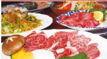
精肉店直営のお肉