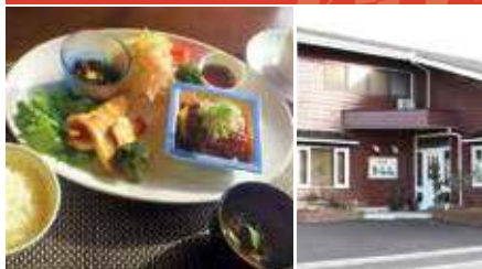
1.日替ランチ1,000円 2.店舗外観