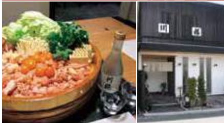
1.百日鶏すき焼き 2.店舗外観