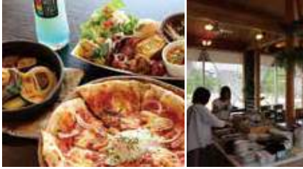
1. スキレット料理 2. お洒落な店内