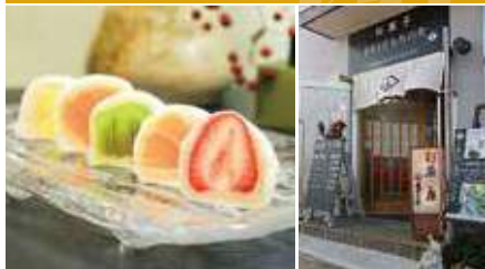
1.果実大福 2.店舗外観