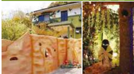
1.店舗外観 2.癒しのひとときを