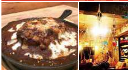
1. ハンバーグドリア 2. ハンモックのある店内