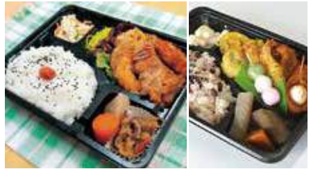
1.日替わり弁当 2.特注弁当(炊きこみも可)