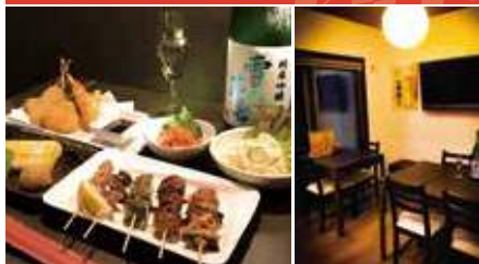
1.5種盛り等 2.個室もあり