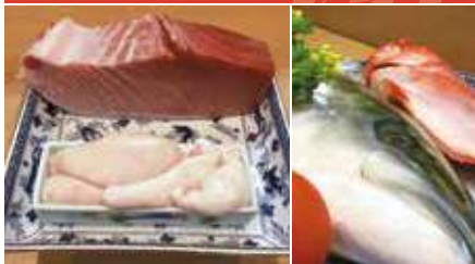
1.まぐろと白子 2.新鮮な食材