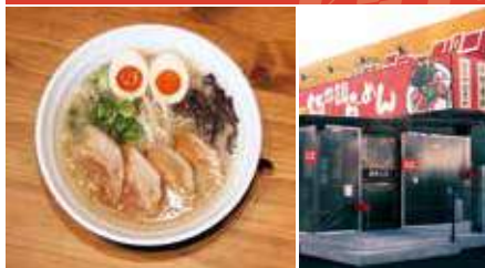
1.とんこつ絶好調白 2.店舗外観