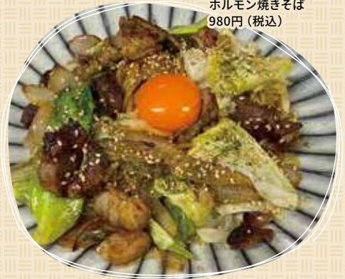
くるま焼肉店 P.16 ホルモン焼きそば 980円(税込)