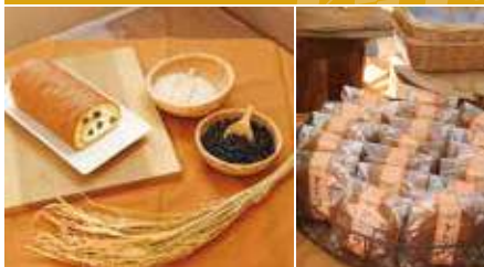
1.恵美ロール 2.かわいっ子