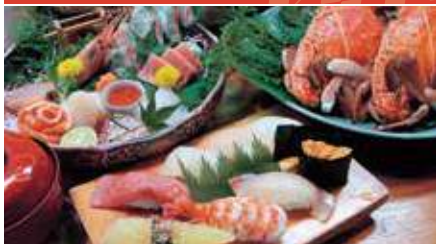
こだわりの寿司や一品料理