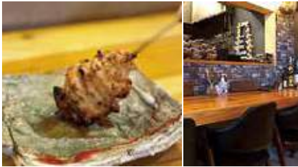
1.自慢の焼き鳥はぶりぶりでジューシー 2.店内