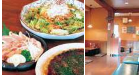
1.人気モノ☆ 2.店の中は…