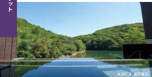
水辺の湯(露天風呂)