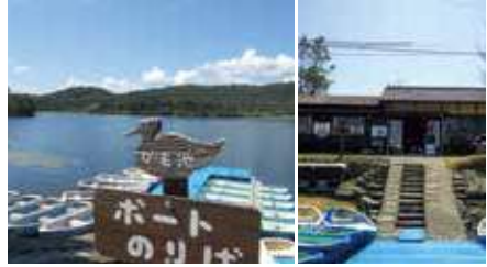
1. 貸しボート 2. 古風な佇まい