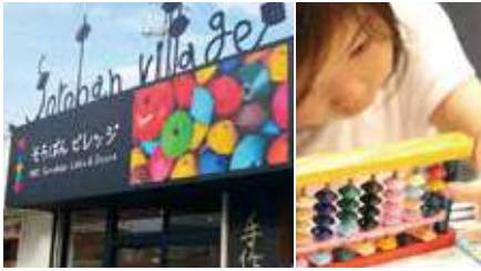
1.店舗外観 2.マイそろばん