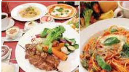
1.おまかせコース 2.ランチメニュー