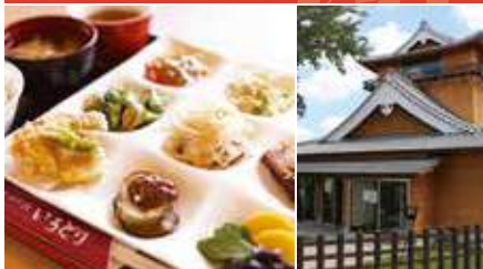
1.おふくろランチ 2.お城を再現した店舗