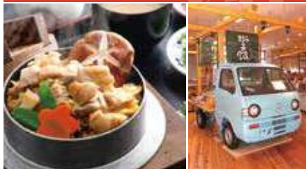
1.人気No.1! 鳥釜飯 2.食事だけでなくお土産も