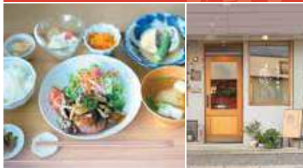
1. なずな膳 2. 店舗外観