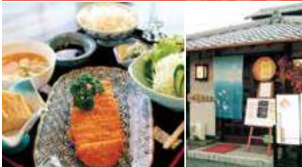
1.とんかつ定食 2.店舗外観