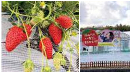
1.真っ赤ないちごがお出迎え! 2.外観