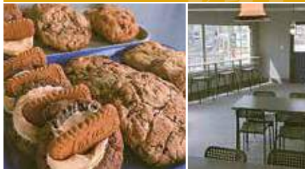
1.店内には焼き立てのスイーツが並ぶ 2.2階にはイートインスペースも