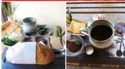
1.コッペパンセット 2.ちよびりデザートSet