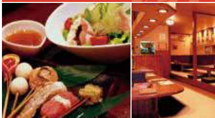
1.創作串揚げ 2.店舗内観