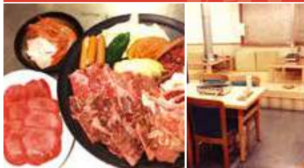
1.盛り合わせ 2.店舗内観