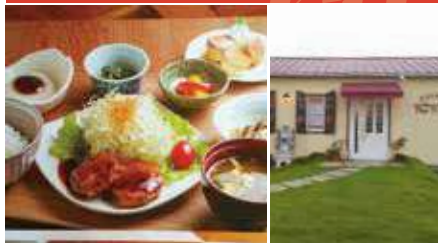
1. 本日のランチ 2. ゆったりとしたひとときを