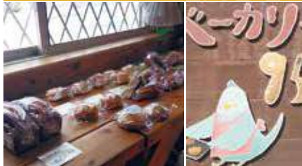
1.ブチパンの棚 2.店舗看板