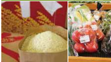
1.施設館内 2.施設外観