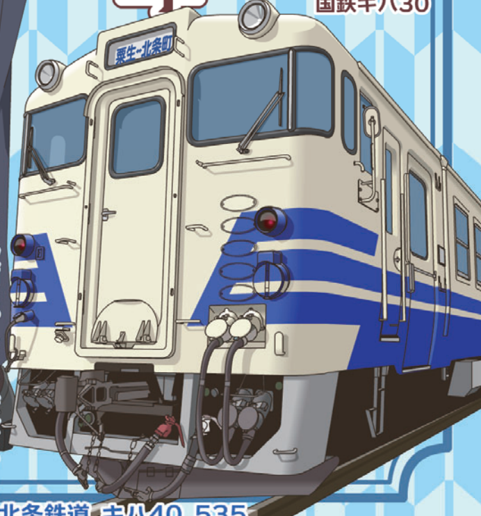
北条鉄道 キハ40 535

より便利に、そして安全に。 これからも、北条鉄道は 地域の大切な交通機関として 活躍して参ります。