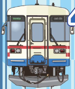
北条鉄道フラワ2000-3 (旧三木鉄道)