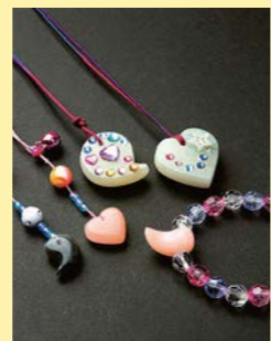
古代の装身具勾玉作り 那珂ふれあい館 ☎0795-32-0685 体験時間 約60分