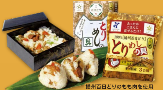
播州百日どりのもも肉を使用「とりめしの具」