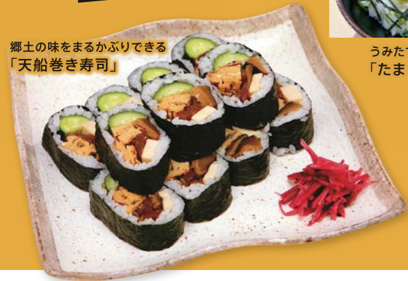
郷土の味をまるかぶりできる「天船巻き寿司」