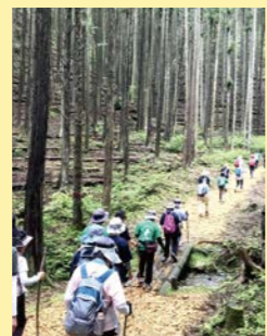
多可の森健康ウォーキング (一社)多可の森健康協会 ☎080-8306-0551 体験時間 約2時間