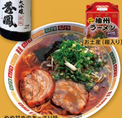
やや甘めのあっさり味「播州ラーメン」