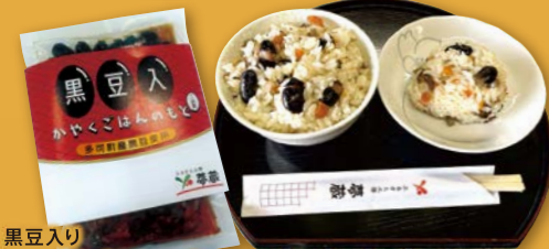
黒豆入り「かやくごはんの素」