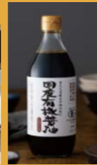
「木桶仕込み 国産有機醤油」