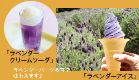
「ラベンダー クリームソーダ」