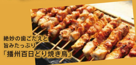
絶妙の歯ごたえと旨みたっぷり「播州百日どり焼き鳥」