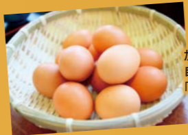
加美の豊かな自然が生んだ「播州地卵」