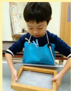
手漉き和紙体験 杉原紙研究所 ☎0795-36-0080 体験時間 約15分

1000年以上の歴史ある杉原紙の紙すき体験から多可町の自然を満喫できる体験まで、世界にひとつだけのオリジナル作品や思い出をつくってみませんか。(※全て要予約)