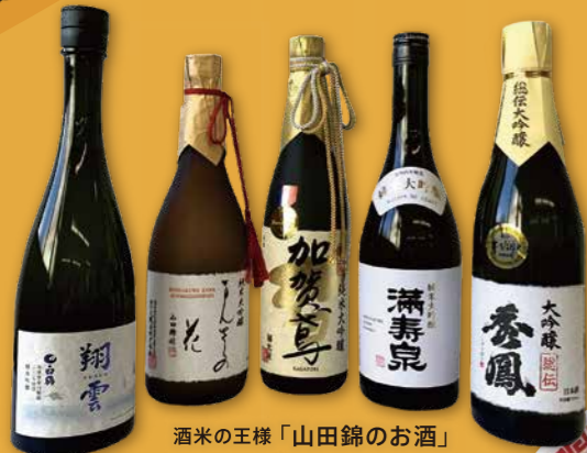
酒米の王様「山田錦のお酒」